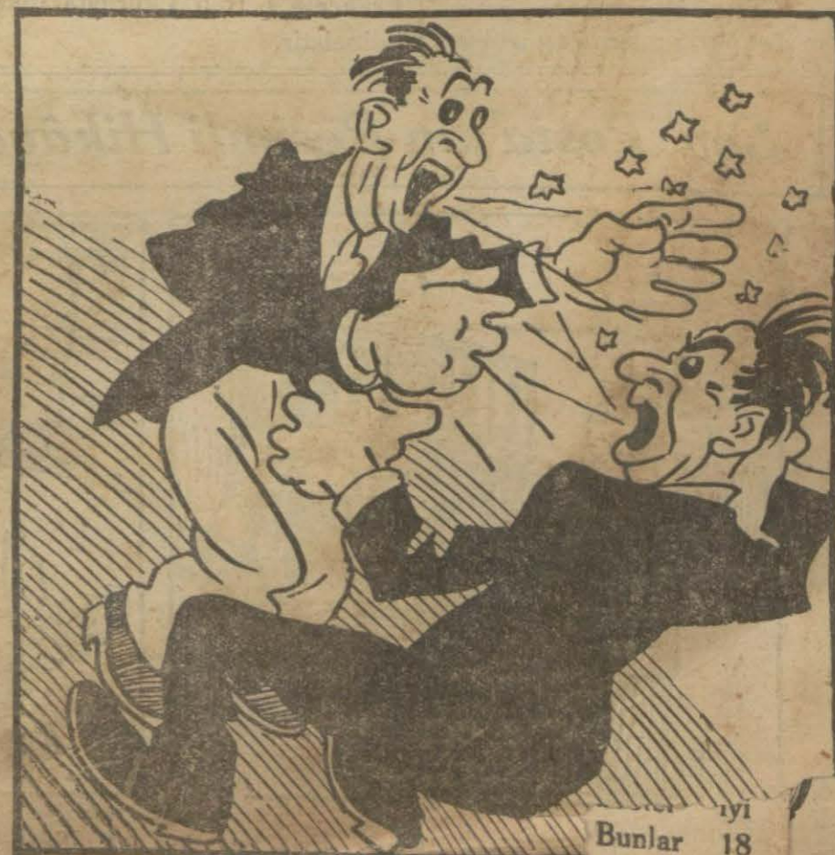
Bunlar 18 Kiymetleri

10 paradan 250 kuruşa kadar- dır. Miktarı 120 milyon ola- caktır.